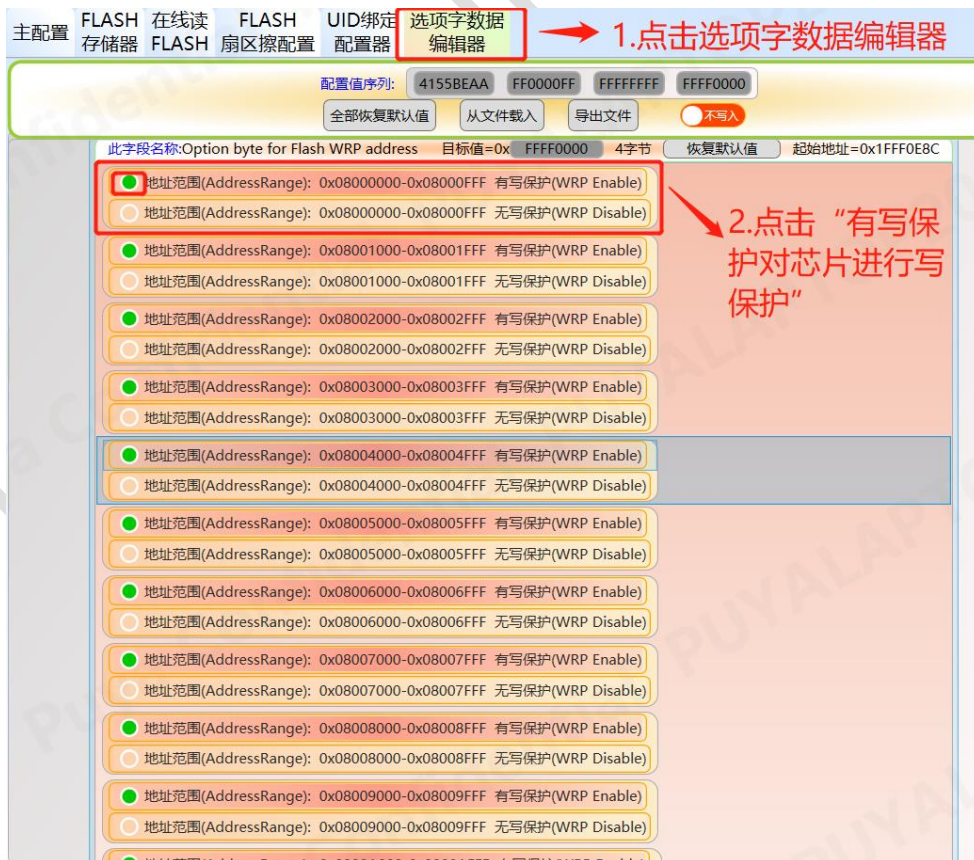
图 11-2 轩微操作 Option 写保护