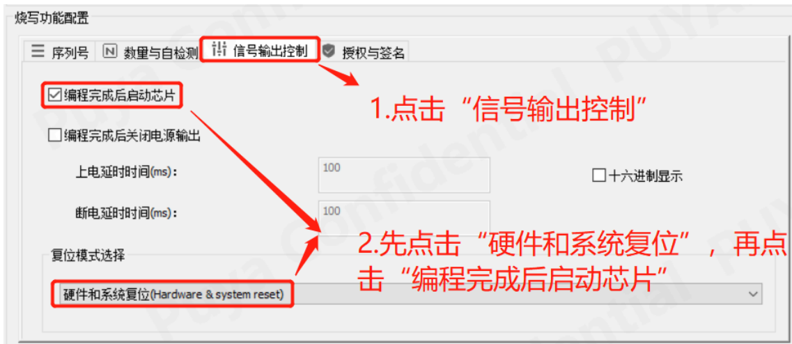
图 11-3 创芯工坊操作勾选“编程后重启芯片”