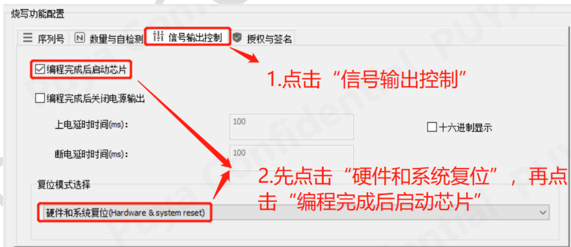
图 17-4 创芯工坊操作勾选“编程后重启芯片”