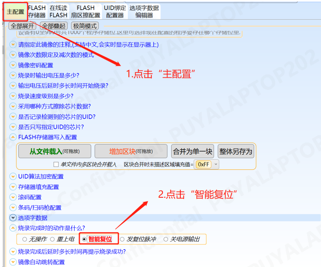
图 17-3 轩微操作“智能复位”